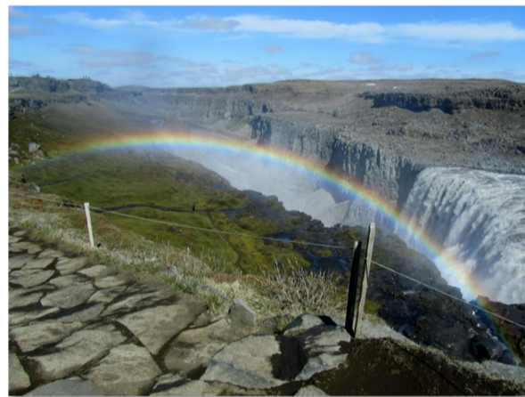
Prázdninový pozdrav od Jirky Judy z Islandu

TYP SCREENSAVER - Nehodí se na nic, ale aspoň tě zabaví.