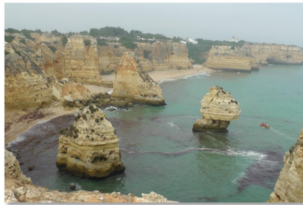
Vzpomínka na léto – Portugalské pláže

Ale i pokud bychom zvládli tuto krizi, neznamená to, že máme vyhráno. Červíček rozkladu a degenerace v naší civilizaci hlodá dál. Když ztichnete a zamyslete se, možná ho uslyšíte.