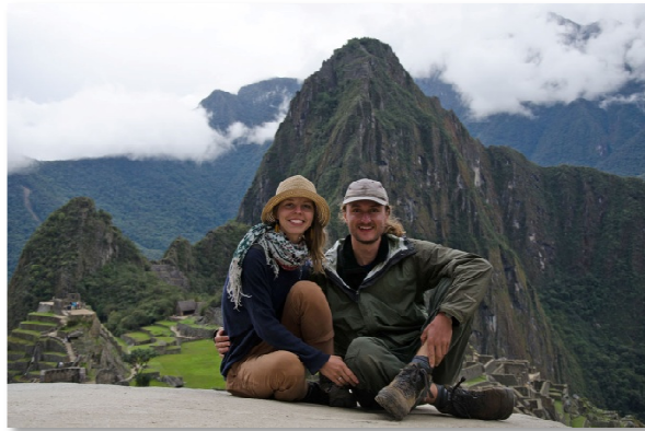
Machu Picchu vysoko v horách.

došlo k tomu, že se jim podařilo vyfotografovat Machu Picchu z výšky. Mladí, co se dobře učili, si dnes mohou zajet prohlédnout i Rio de Janiero.