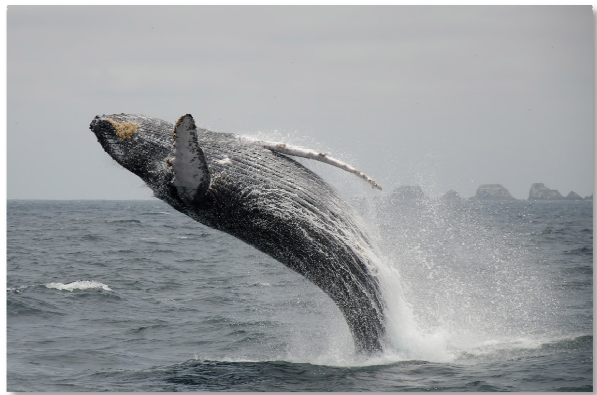
Z výletu na Isla de la Plata (Galapágy chudých) v Ekvádoru