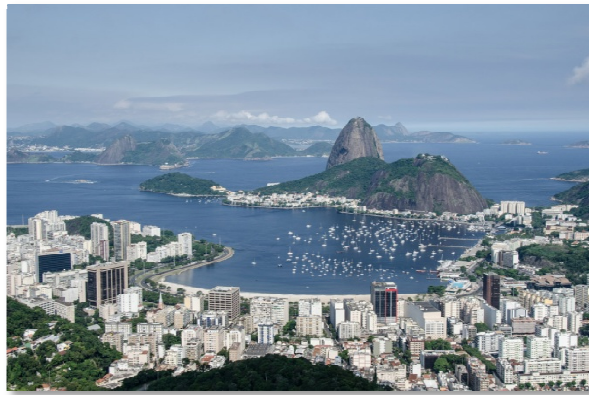
Mladí, co se dobře učili, si dnes mohou zajet prohlédnout i Rio de Janiero.