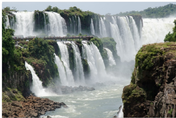
Vodopády Iguazú na hranici Argentiny a Brazílie.